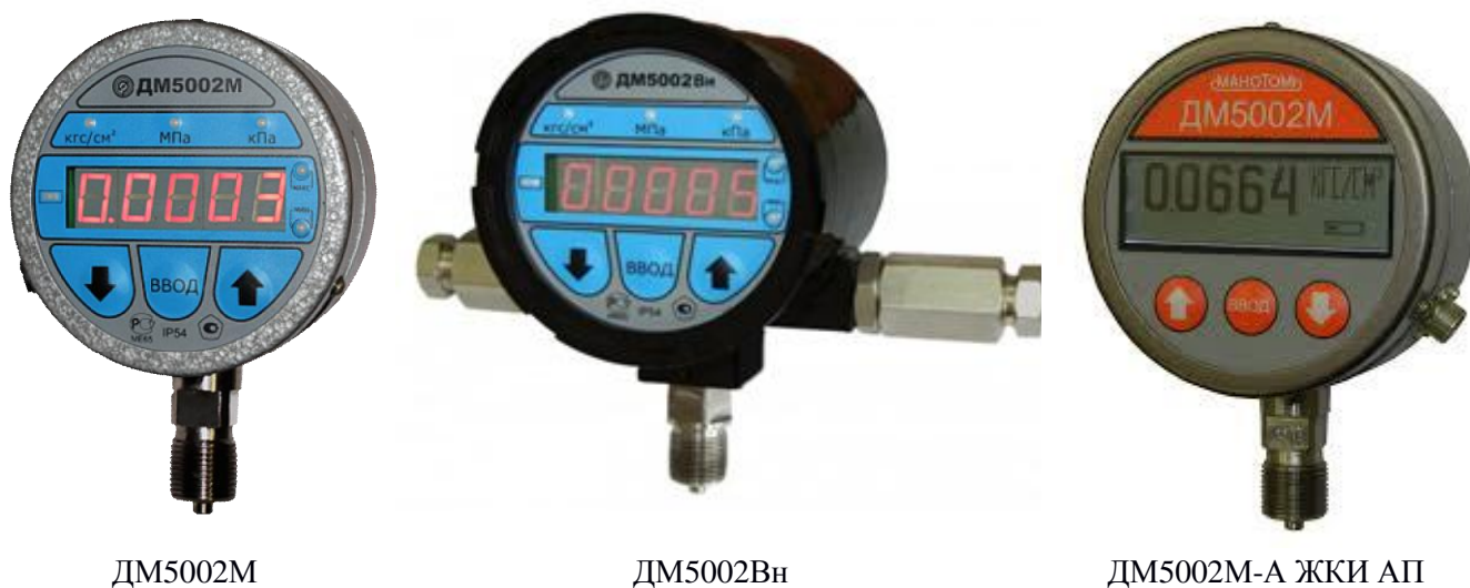
Рисунок 1 – Фотографии общего вида манометров цифровых ДМ5002М, ДМ5002Вн

Общий вид приборов представлен на рисунке 1.