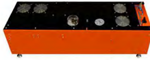
Электропневматический усилитель давления K-450