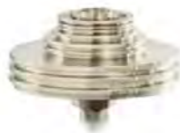
Измерительные поршневые системы МП и МГП с наборами грузов

Измерительные поршневые системы МП и МГП с наборами грузов.